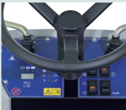
Die SW4000 spart Energie und Material durch automatisch anhaltende Besen im Stillstand.