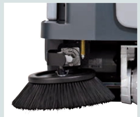
DustGuard™-System (optional) für weniger Staubaufwirbelung beim Kehren.